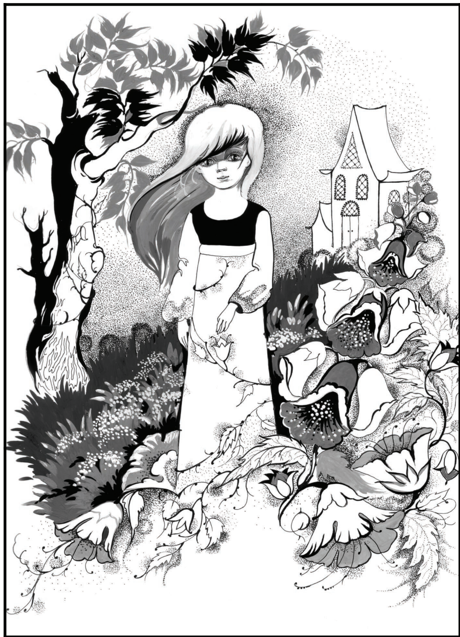
5 Хар кадын болгаш өске-даа чугаалар